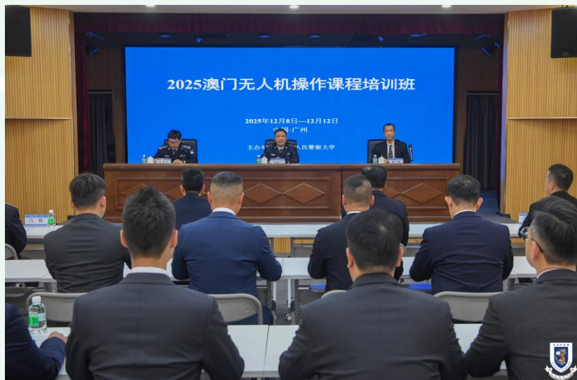
“2025 無人機操控課程” 開班儀式