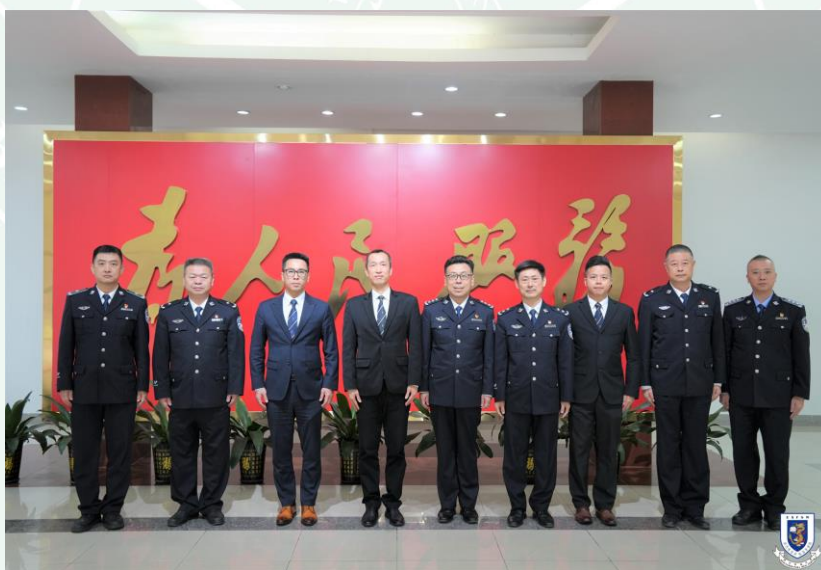
到訪廣東警官學院