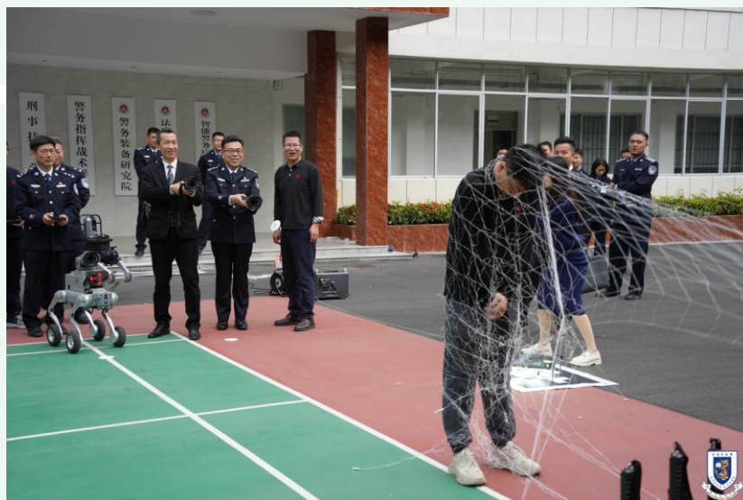
參觀智慧警務裝備

保安高校此次對中國人民警察大學（廣州）及廣東警官學院的訪問，進一步深化了與內地公安院校的聯動協作，有助於共同推動警務教育創新與人才協同培育，為社會持續輸送兼具專業能力與使命擔當的警務人員。